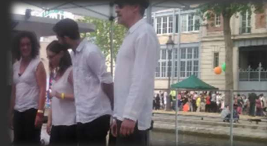
70 €/ mois