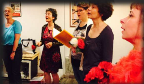
JANVIER 2020/ QUATUOR FEMININ : adultes avec expérience vocale