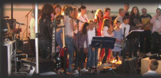
2 vendredis par mois de 14H à 15H30